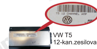
VW T5 12-kan.zesilovač