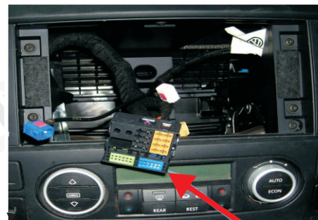
Konektor OEM audiosystému

1. Vodiče napájecího kabelového svazku připojte v konektoru autorádia