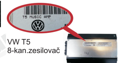
VW T5 8-kan.zesilovač